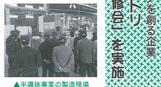
▲半導体事業の製造現場