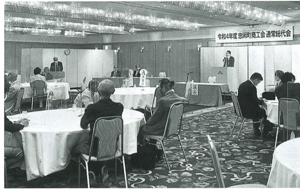
第62回通常総代会が、杉原町長、和田議会議長を来賓として迎え、5月