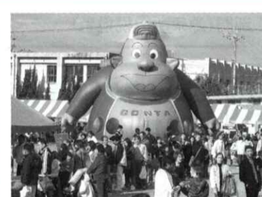
ふわふわエアポリン