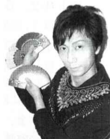
マジックショー ユー・ジ南