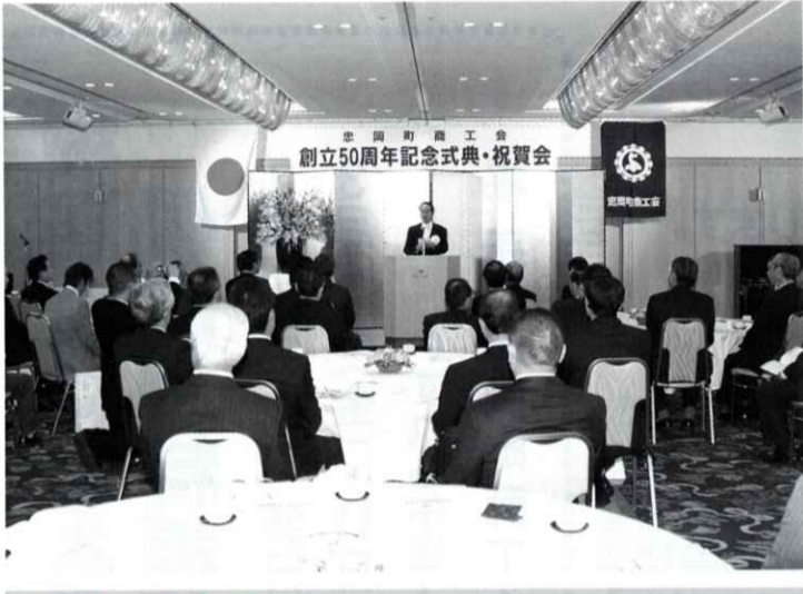
商工会法施行50周年 商工会は行きます 聞きます 提案します!

忠岡町商工会は、昭和35年11月に、府内第一番目の商工会として発足して、これを記念し、11月23日、小規模事業振興と地域経済の発展に尽力し、来賓をお迎えし、商工50年の歴史を振り返り、会の運営・発展に貢献された方々の功績をたたえ、創立50周年記念式典を挙げて、創立50周年記念式典