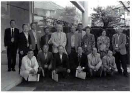
大和ハウス工業 総合技術研究所にて

10月19日(水)、商工業部会の合同研修会が、15名の参加を得て開催され、「大和ハウス工業総合技術研究所」と「月桂冠大倉記念館」をそれぞれ見学しました。大和ハウス工業の経営ノウハウや耐震・免震等研究技術、月桂冠の商品開発等を学び、参加者か