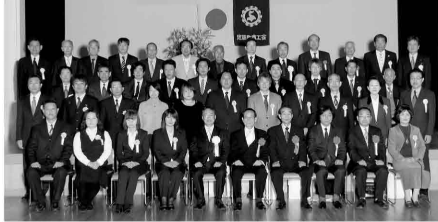
表彰式に出席された方々