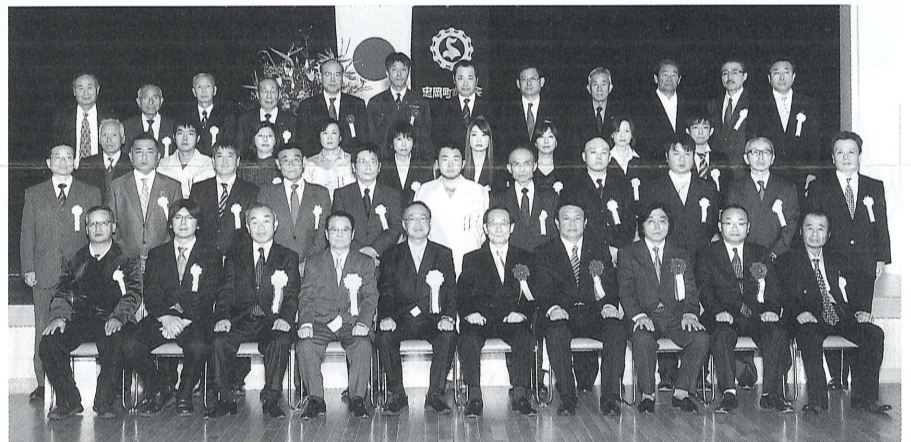
表彰式に出席された方々

11月24日、忠岡町シビックセンターふれあいホールにおいて、平成24年度忠岡町商工会表彰式を挙行政しました。当日は、和町町長をはじめ関係多数のご来賓をお迎えし、商工会員事業所において、永年事業の発展に貢献された優良従業員23名、優良店舗・事業所6会員に対する表彰を執り行い、次の方々が表彰されました。(敬称略・順不同)