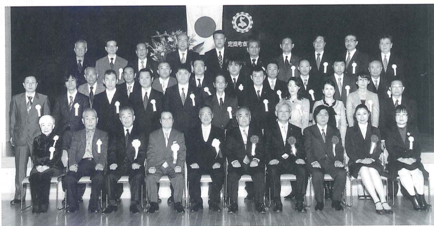
表彰式に出席された方々

11月24日、忠岡町シビックセンターふれあいホールにおいて、平成25年度忠岡町商工会表彰式を挙行政致しました。 当日は、関係多数のご来賓をお迎えし、商工会員事業所において、永年事業の発展に貢献された優良従業員、優良事業所に対する表彰式を執り行い、次の方々が表彰されました。 (敬称略・順不同)