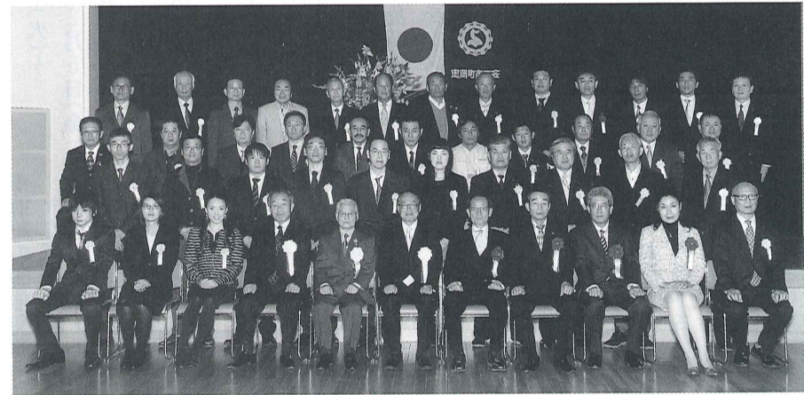
表彰式に出席された方々(於シビックセンターふれあいホール)