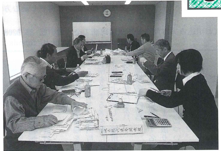
地区総代選挙の開票作業