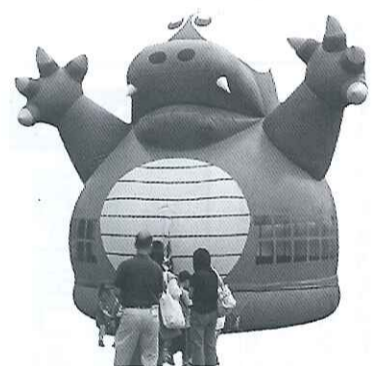
ことしはふわふわ竜太くんだよ

ミニSL、ふわふわエアポリン、各種団体による模擬店・バザー、商連ガラガラ抽選会、行政なんでも相談、献血車、あてものコーナー、キャラ似顔絵コーナー、建設機械の撮影コーナー、血压測定、健康相談・介護相談、自動車展示、キッチンカー、お好み焼き教室