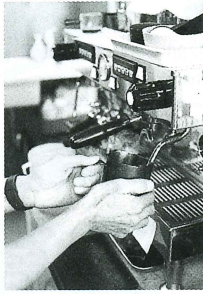
▲エスプレッソマシンで淹れる様子