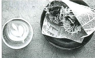
▲エスプレッソラテとブルドポークサンド